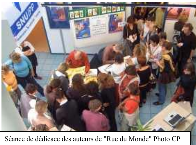
Séance de dédicace des auteurs de "Rue du Monde"