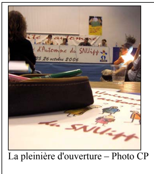
La plénière d'ouverture