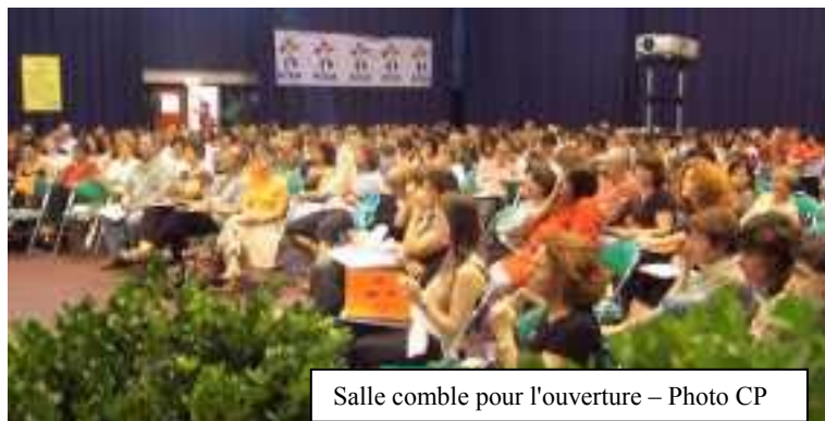
Salle comble pour l'ouverture